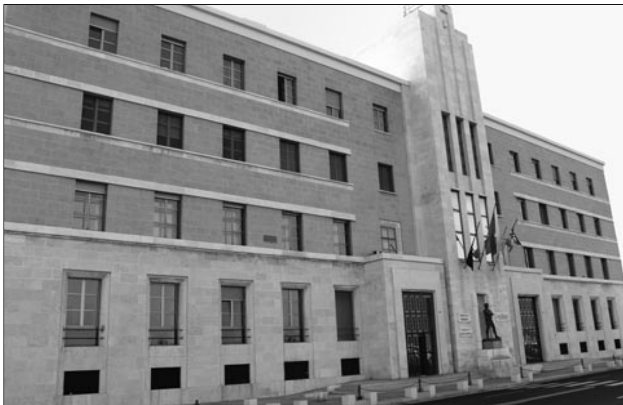
Sede Presidenza Giunta Regionale